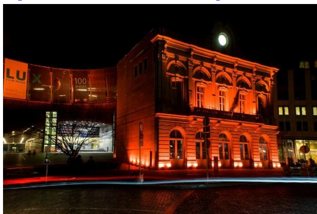
Il Parlamento europeo si tinge di arancio per celebrare la giornata per l'eliminazione della violenza contro le donne

Siamo nel 2016 ed è avvilente dover continuare a ricordare che le donne e gli uomini sono uguali e che una ragazza su tre in Europa ha sperimentato la violenza sulla propria pelle. Alla vigilia della Giornata internazionale per l'eliminazione della violenza contro le donne, i deputati hanno invitato l'Unione europea ad aderire alla convenzione di Istanbul per prevenire ed evitare più